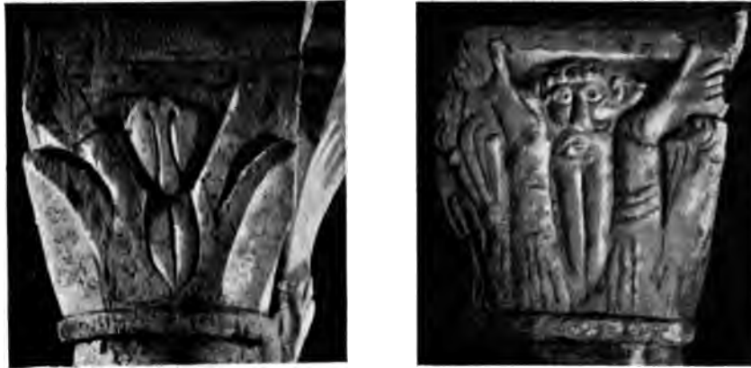
Chapiteaux de la crypte de Saint-Bénigne.

Dans les chapiteaux contemporains de la fondation qui font le tour de la crypte, et où l'on a voulu quelquefois reconnaître la main d'un jeune moine appelé Hunald, l'art est tombé au niveau de la caricature, et le mot d'ornement constitue une impropriété, appliqué à des reliefs dont on ne peut avoir aucune idée, si on ne les a vus. Imaginons un corps oval, fendu sur toute sa longueur, des jambes qui remontent et encadrent la tête à moins qu'elles ne soient des bras, et, dans cette tête, l'œil, les joues, le nez, la bouche, figurés tout ensemble par deux arcs de cercle entre lesquels se dessine une trompe..., et nous aurons à peu près l'im-